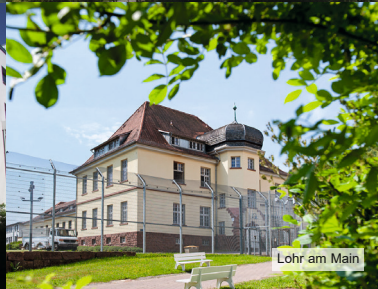
Lohr am Main