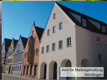
Amt für Maßregelvollzug Nördlingen